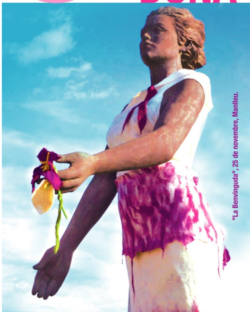
"La Benvinguda", 25 de novembre, Manlleu.