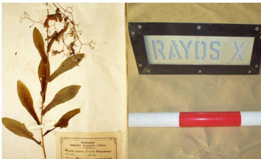
Les col·leccions del Museu del Ter

A finals de l'any 2016, les col·leccions del Museu del Ter estaven formades per un total de 5.389 objectes registrats. D'aquests, 2.598 són de ciències naturals; 2.134 són d'història local, etnologia i ciència i tècnica, i 657 de materials arqueològics procedents de diferents jaciments de Manlleu. Durant el 2016 s'han incorporat a la col·lecció i s'han catalogat 489 nous objectes.