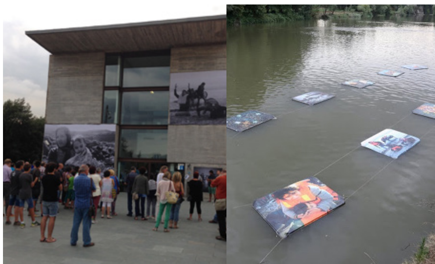
El Ter mor al Mediterrani, de Sergi Cámara

Aquesta exposició ens va acostar a la terrible situació dels refugiats amb imatges preses a les illes gregues de Lesbos i Kos pel fotògraf documentalista Sergi Cámara, i volia ser un crit per reclamar un passatge segur per a les persones refugiades, una via segura que no els obligui a tirar-se al Mediterrani, arriscant així la seva vida i la dels seus familiars. La xifra de morts al Mediterrani ha anat augmentant dia rere dia, i n'ha convertit les aigües en una autèntica fossa comuna on han perdut la vida més de 30.000 persones des de l'any 2000. L'exposició va ocupar les façanes exteriors del Museu i es completava amb un conjunt de 10 fotografies flotants sobre el riu Ter. Es va poder veure durant el mes d'agost.