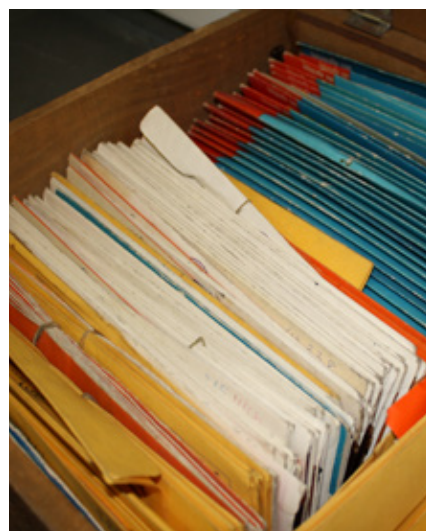
El creixement dels fons de fotografia local