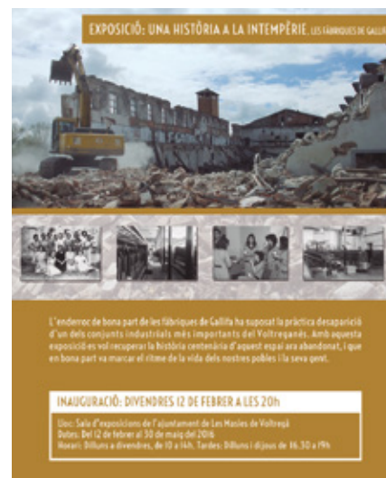
Una història a la intempèrie: les fàbriques de Gallifa

UN CRIT PER RECLAMAR UN PASSATGE SEGUR PER A LES PERSONES REFUGIADES